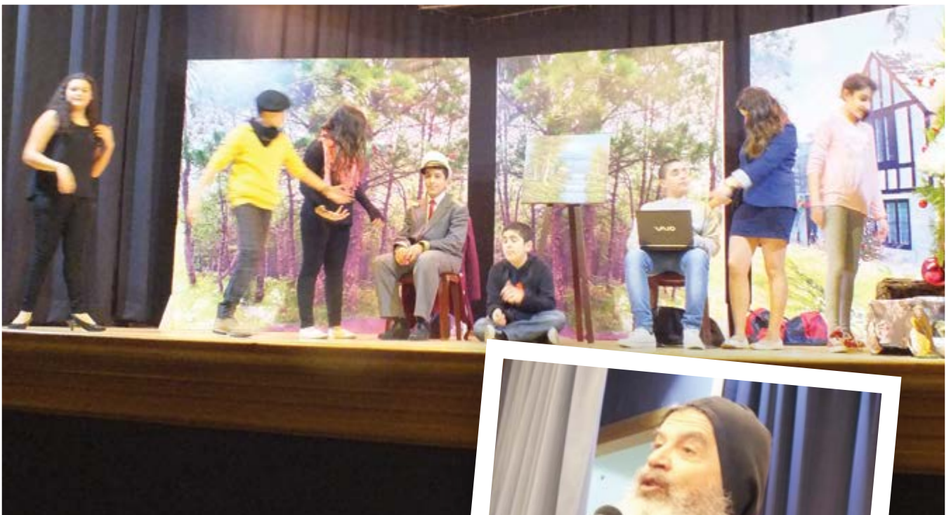
Arriba: escena de la presentación