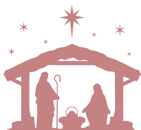
DES SCÈNES DE LA Mission de Noël 2018